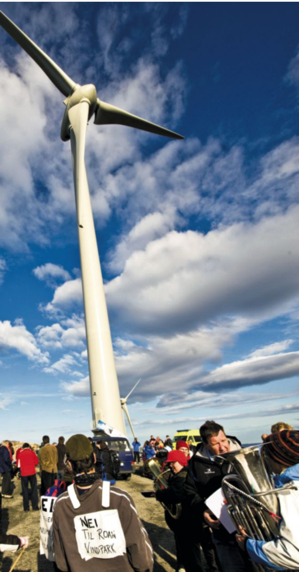
Vindkraft: Vindmøllene på Bessakerfjellet (bildet) i Roan og en håndfull på Valsneset i Bjugn er fortsatt de eneste som er i produksjon på Fosen. Bildet er fra åpningen i 2008.